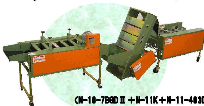
(N-10-7BGD II + N-11K + N-11-403D)