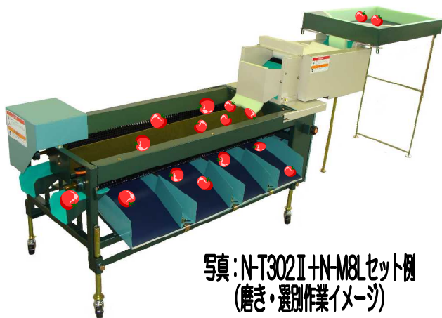
写真: N-T302II+N-M8Lセット例 (磨き・選別作業イメージ)